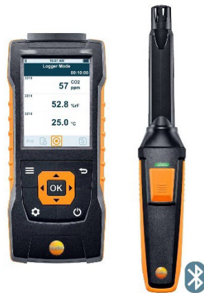
Figuur: Voorbeeld van een draagbaar CO 2 -meetinstrument

Een instrument dat de gemeten waarde rechtstreeks op een scherm weergeeft, heeft het voordeel dat het gemakkelijk een onmiddellijke meting mogelijk maakt, en eventueel rechtstreekse informatie aan de mensen in de ruimte.