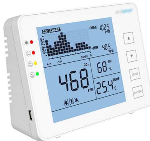
Figuur: Voorbeeld van een CO 2 -meetinstrument met informatie over de ontwikkeling van de CO 2 -concentratie